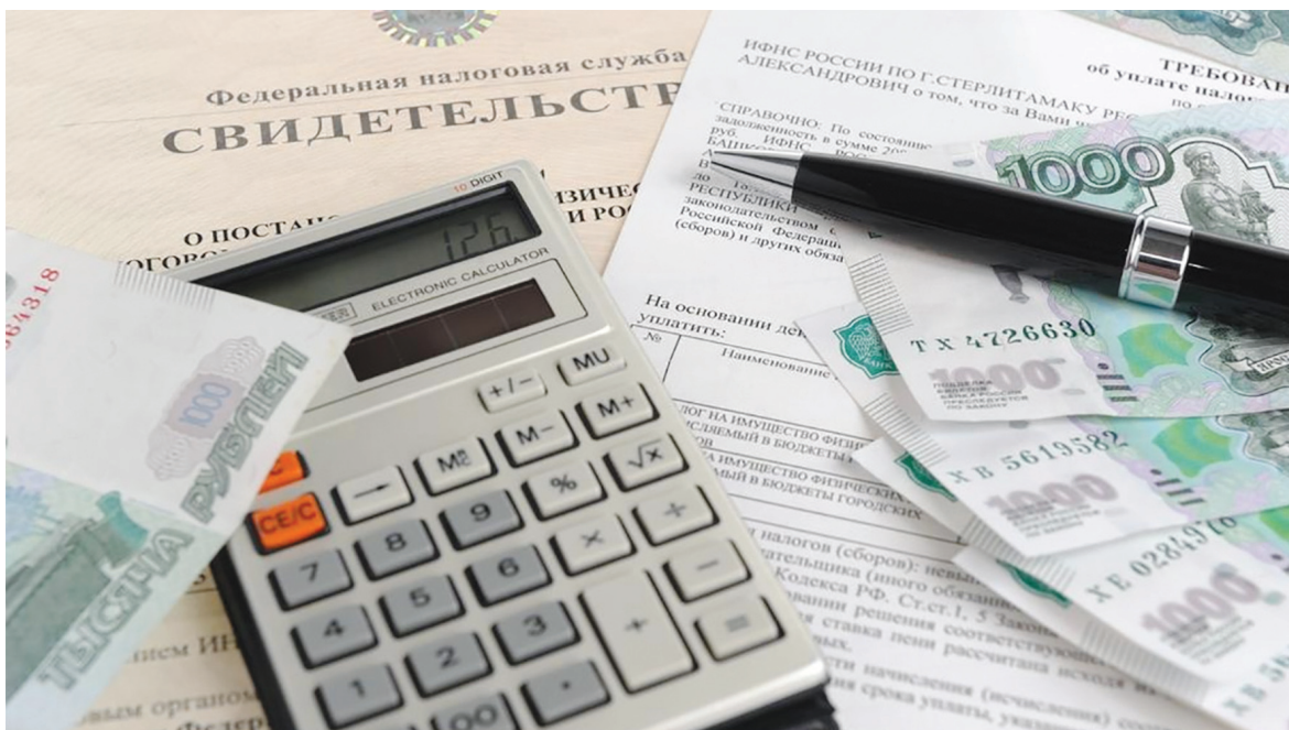
Если знать свои права, можно вернуть часть денег, потраченных на приобретение недвижимости за счет имущественного налогового вычета.