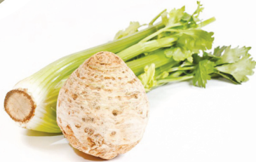
Этот овощ любят те, кто соблюдает диету. В 100 г продукта содержится всего лишь 16 ккал. Кроме того, в сельдерее много клетчатки, которая очищает кишечник, выводит из организма шлаки и токсины. Но овощ трудно переваривается, а потому в день здоровому человеку можно съесть не больше 70 г сельдерея, это два-три стебля. Лучше всего употреблять его с жирными продуктами. Например, вместе

21. Когда в церкви народ осеняет крестом или Евангелием, образом или Чашей, то все накладывают на себя крестное знамение, преклоняя голову. Когда кадят к предстоящим, то не следует осенять себя крестным знаменем, а нужно только преклонить голову. Лишь в святую седмицу Пасхи, когда кадит священник с крестом в руке, возглашая: «Христос воскрес!» – все осеняют себя крестным знаменем и восклицают: «Воистину воскрес!».