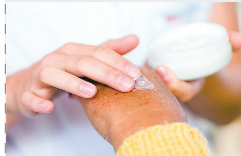
ПО ВОЗМОЖНЫМ ПРОТИВОПОКАЗАНИЯМ ПРОКОНСУЛЬТИРУЙТЕСЬ С ВРАЧОМ