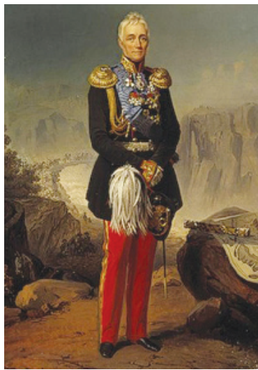
Михаил Семенович Воронцов (1782 – 1856 гг.)

Будучи назначенным генерал-губернатором Новороссии, он проявил себя незаурядным