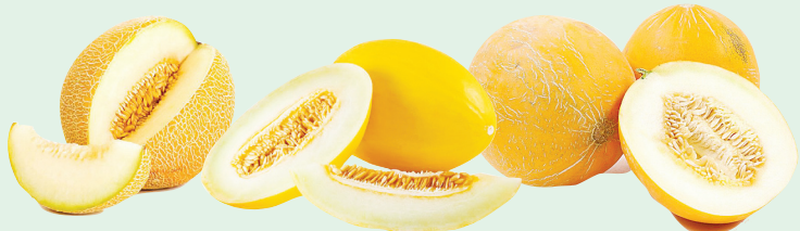
ПО ВОЗМОЖНЫМ ПРОТИВОПОКАЗАНИЯМ ПРОКОНСУЛЬТИРУЙТЕСЬ С ВРАЧОМ

Противопоказания – в следующем номере «КН»