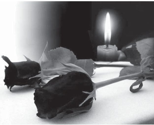
Бессмысленно откупаться от умерших пышными похоронами и надгробьями, наша любовь к ним – наша личная молитва и жизнь по заповедям.

Кстати, святые относились к погребению совсем не так, как большинство из нас, для которых тело остаётся единственным символом связи с умершими. Видимо, тут в людях действует подсознательный материализм или атеизм. Посмотрите, какие величественные надгробия, пирамиды, мавзолеи соорудили и продолжают воздвигать! А вот святые относились к этому по-иному. Многие из них завещали ученикам выбросить своё тело диким зверям. Другие, видя благоговейное отношение к себе собратьев, просили закопать своё тело так, чтобы о месте никто и не знал. Наш русский святой преподобный Нил Сорский так завещал, и до сих пор неизвестно место его погребения. Святые исходили из библейских слов самого Бога: «Возвратишься в землю, из которой ты взят, ибо прах ты и в прах возвратишься». Эта же мысль повторяется и в православном заупокойном богослужении: «Паки мы возвратимся в землю, от неже взят бых». То есть Церковь прямо говорит о теле умершего: это прах, пепел, земля и ничего более. Поэтому способ превращения тела в «прах» не имеет никакого религиозного