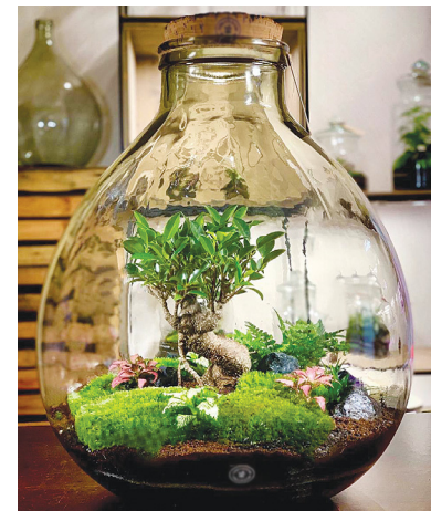
Садик в бутылке – это стильно и модно.

Как только уровень влажности окажется оптимальным, стекло станет прозрачным. После этого сад можно не открывать очень долгое время.