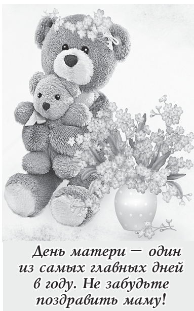
День матери – один из самых главных дней в году. Не забудьте поздравить маму!

Этот замечательный день уже обрёл свои традиции. Так, у него появился символ – незабудка. Изображения плюшевых мишек с незабудкой в лапках – тоже атрибут праздника.