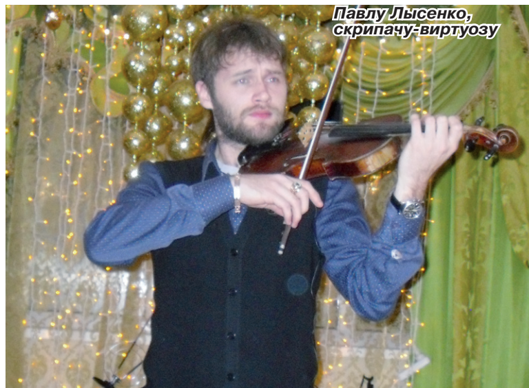
Павлу Лысенко, скрипачу-виртуозу

Как неустово скрипка рыдает В твоих нежных и чутких руках! От восторга душа замирает И вершит свой полет в облаках.