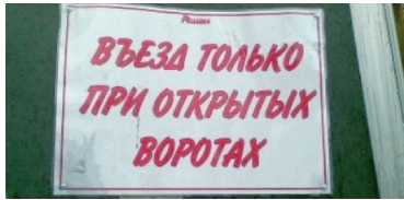
Задолбали уже в закрытые ворота въезжать.