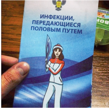
Печальная судьба российских факелоносцев.

В этом материале лучшие маразмы и курьезы с просторов России и стран бывшего Советского Союза, присланные в редакцию AdMe.ru и появившиеся в сети за последний месяц.