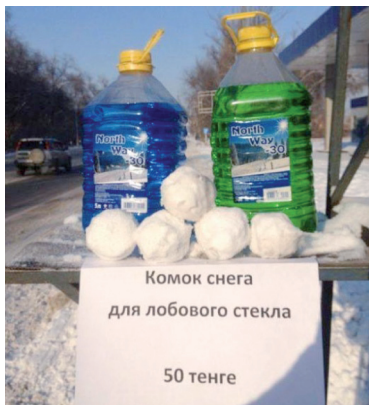
Мастер-класс «Как выгодно продать снег зимой».