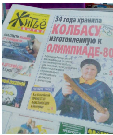
Очень странный повод для гордости.