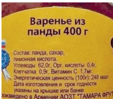
Кто пробовал, вкусно?