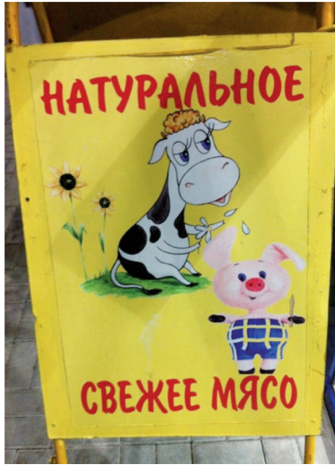
Пятачка в расход пустили.