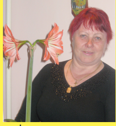
Дочь, зять, внуки, г. Минеральные Воды.

Мамочка любимая, родной мой человек! Богом ты хранима будь на целый век! Пусть не доберется до ясных глаз печаль, Пусть губ твоих коснется Смех звонкий, как хрусталь! Будь всегда здорова, счастлива, нежна. Ведь ты – семьи основа, ты очень нам нужна! Приятных слов для мамы всех не перечести! Спасибо тебе, мамочка, что ты на свете есть!