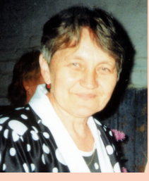
Мама, сестра, дети, внуки, с. Горнозаводское Кировского р-на.

Будь все время красива и душой, и собой! Будь ты всеми любима и весной, и зимой! Не склоняйся рябиной, если грянет беда. Будь ты самой счастливой в этот день и всегда!