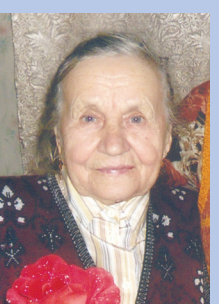
Искренне и нежно любящие тебя дети, внуки, правнуки, с. Горнозаводское Кировского р-на.

Мамулечка наша родная! С праздником тебя, дорогая! Ты, как солнца яркий лучик, Даришь радость и тепло. Никого нет в мире лучше, Нам с тобою повезло! Поздравляем с женским днем! Счастья, радости во всем!