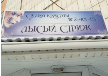
Творчество бессмысленного креатива из Казани.