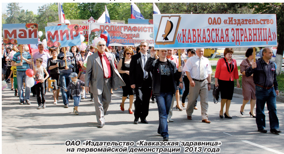
ОАО «Издательство «Кавказская здравница» на первомайской демонстрации 2013 года

Первый майский день всегда вызывает особые чувства в душах людей – пробуждающаяся природа рождает надежды на лучшее будущее, активизирует творческие силы, стимулирует созидательную деятельность человека. Меняясь вместе со временем, этот день не утратил своего значения как праздник единства и сплоченности, олицетворяющий всеобщее стремление к миру, благополучию и счастью. Особо в этот день мы чествуем людей труда, ведь они – главная движущая сила нашего общества, его надежда и опора. Сегодня этот праздник отмечается в 142 странах и территориях мира.