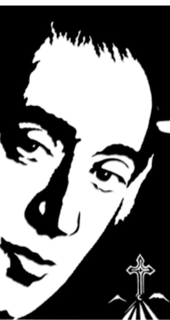
Юрий Багдасаров олицетворяет графику, монументальное искусство.