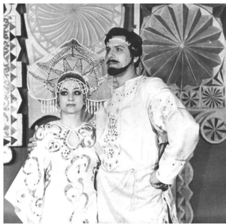
Евгений Зайцев — актер и режиссер. На фото — в роли «Скрипки на крыше».