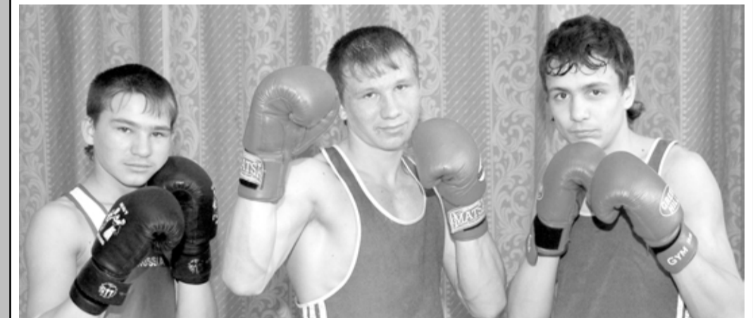
Списки чемпионов первенства края открывают 18 имен. Среди них четверо пятигорчан — безоговорочных лидеров, воспитанников Детско-юношеской спортивной школы № 2...