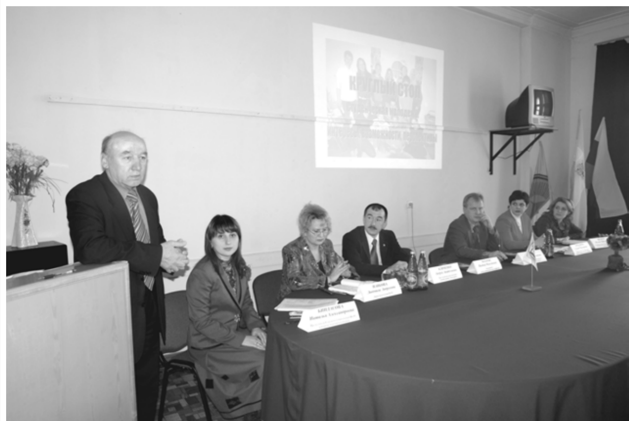
В Институте экономики и управления под руководством ректора...