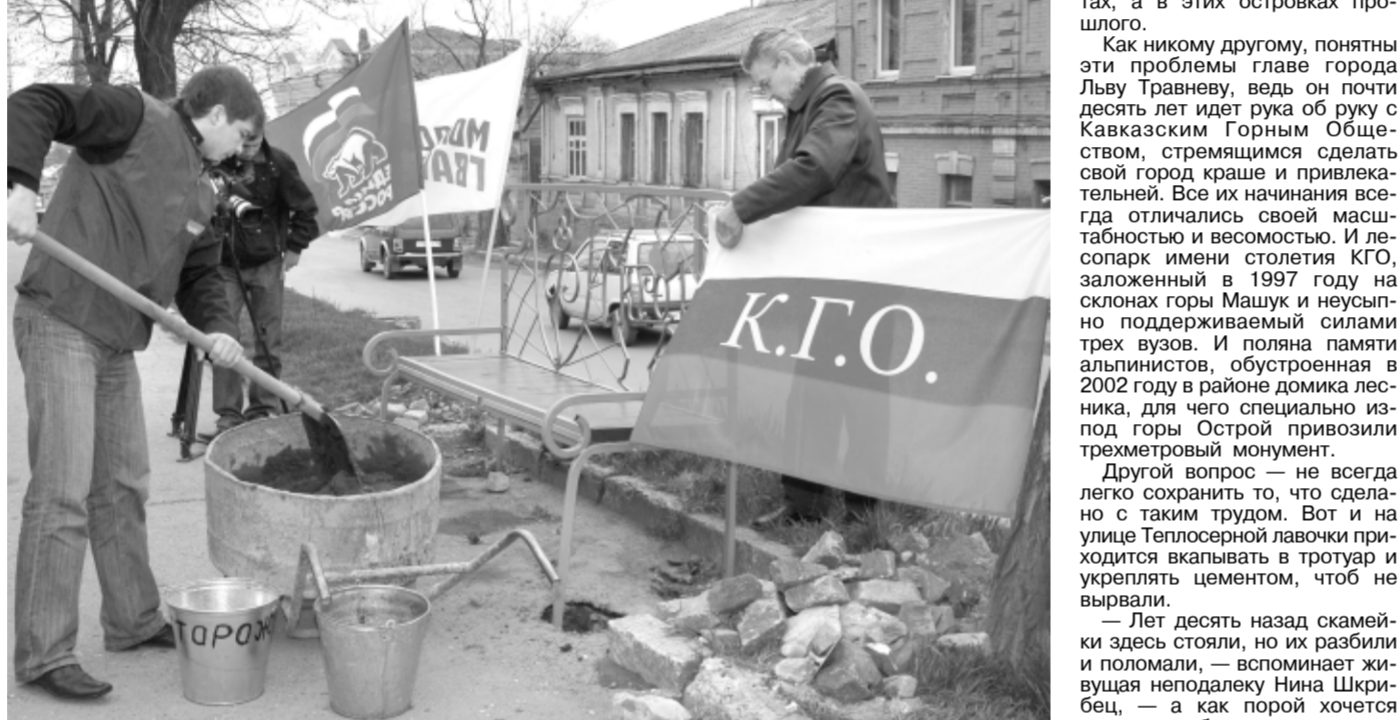
Старый бульвар на Теплосерной, что у Нижних радоновых ванн, обычно тихий и задумчивый, в прошлую субботу стал одним из самых оживленных мест в городе.