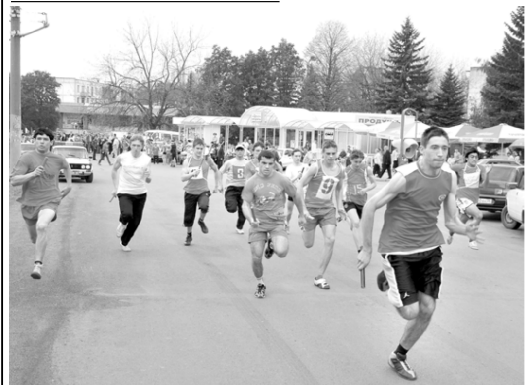
Май ознаменован одним из самых главных праздников нашей страны — Днем Победы. В честь этого памятного дня проводится массовая спортивная акция «Пятигорская правда».

С ГОДАМИ менялся маршрут эстафеты. С самого начала она стартовала от железнодорожного вокзала, шла по «Аллее героев», проспекту Кирова и финишировала в Цветнике. Спустя годы, а именно с 1997 по 2001 гг., эстафету перенесли на Ромашку. По этому же маршруту бежали и в этом году: стартовали в Цветнике, а финишировали в «Фучике».