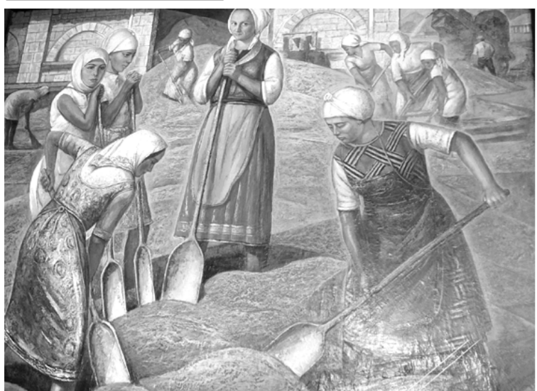
В кисловодском Выставочном зале открылась выставка художников Кавминвод «Кисловодское лето».