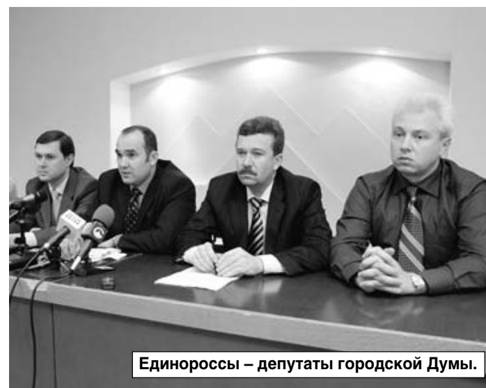
Единороссы — депутаты городской Думы.

В программе благоустройства города нашлось место и решению вопросов освещения курортной зоны, реконструкции местных парков. Был создан Градостроительный совет, который сегодня тщательно следит за соблюдением интересов города и горожан при строительстве разного рода объектов. Однако за «курортными делами» не остались незамеченными и проблемы городских районов.