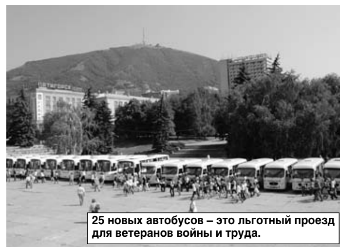
25 новых автобусов — это льготный проезд для ветеранов войны и труда.