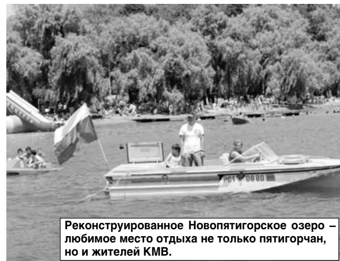
Реконструированное Новопятигорское озеро — любимое место отдыха не только пятигорчан, но и жителей КМВ.