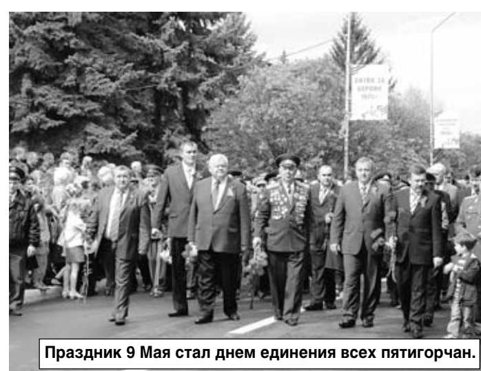
Праздник 9 Мая стал днем единения всех пятигорчан.