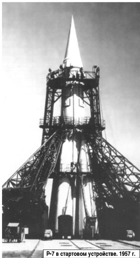
Р-7 в стартовом устройстве. 1957 г.