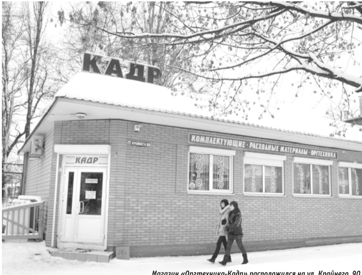
Магазин «Оргтехника-Кадр» расположен на ул. Крайнего, 90.

шок — как жить дальше материально незащищенной.