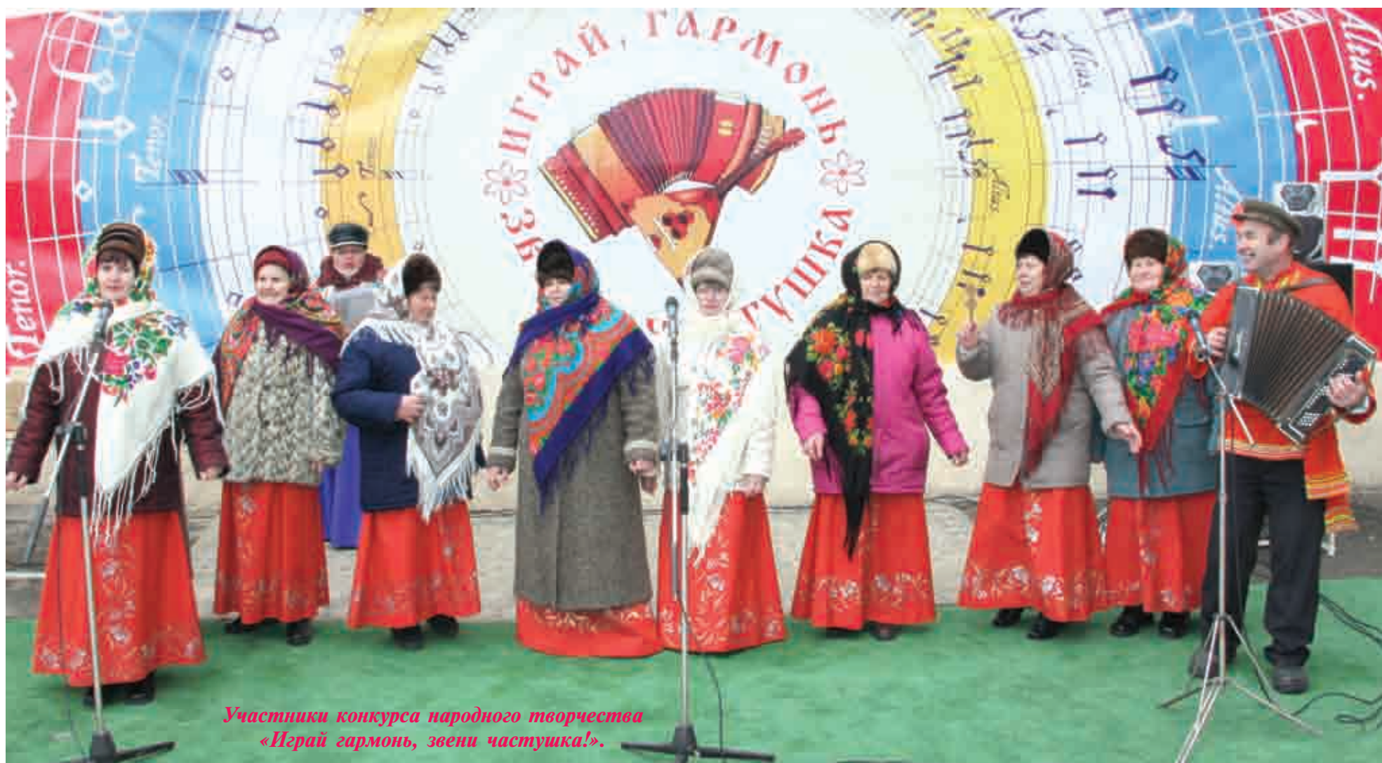
Участники конкурса народного творчества «Играй гармонь, звени частушка!».