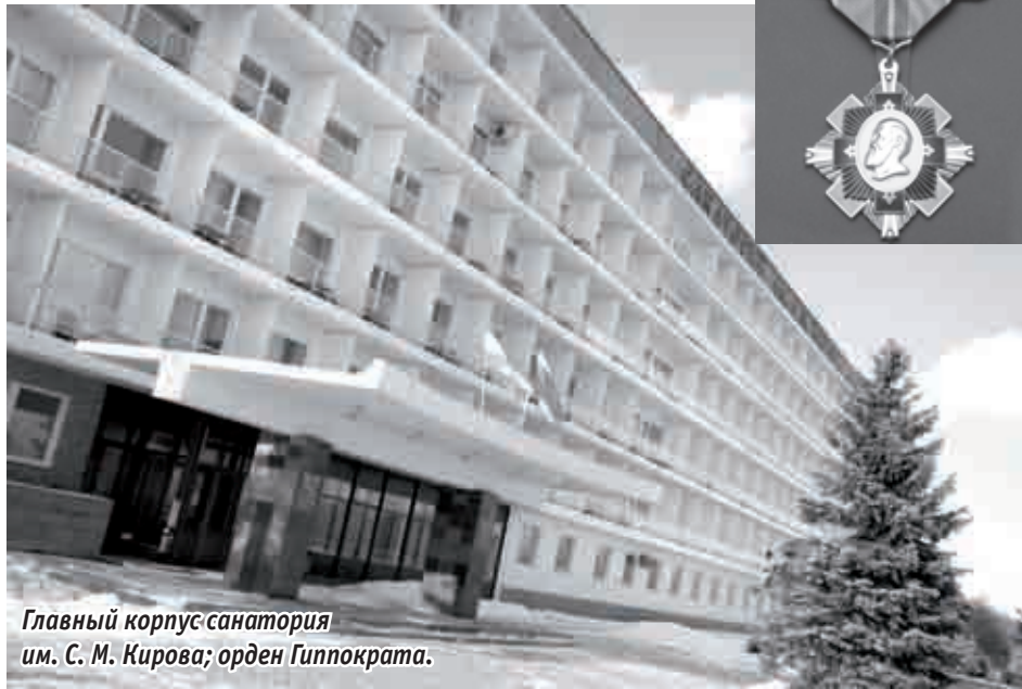
Главный корпус санатория им. С. М. Кирова; орден Гиппократова.

— В год у нас бывает около трех тысяч отдыхающих, часть из которых получают бесплатные услуги. В их числе — чернобыльцы. По квоте Министерства здравоохранения посылаем путевки во все 89 регионов России по программе «Мать и дитя». Кстати, у нас создано единственное