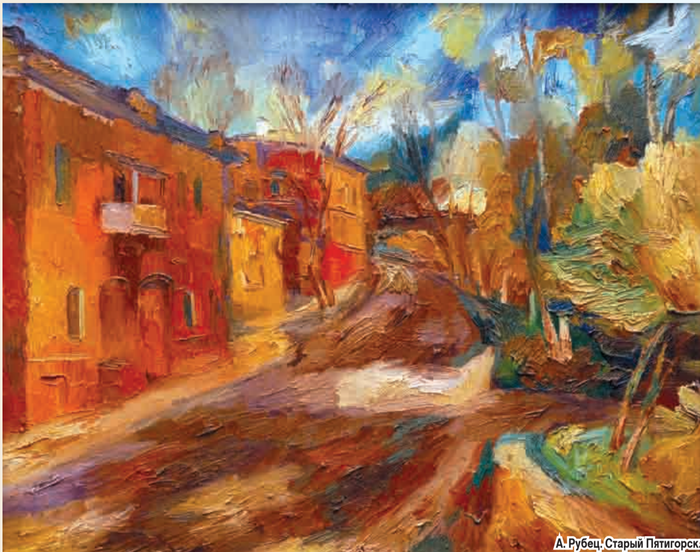
А. Рубец. Старый Пятигорск.

Пятигорская земля богата художниками и новые выставки тому подтверждение.