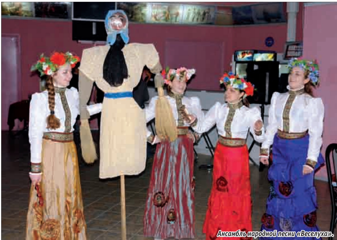
Ансамбль народной песни «Веселуха».

М асленица — древний славянский праздник, доставшийся нам в наследство от языческой культуры. Он знаменует конец зимы и начало весны. Наши предки отмечали его с небывалым размахом — эта неделя была, пожалуй, самой веселой в году. А что нам мешает последовать их примеру?!