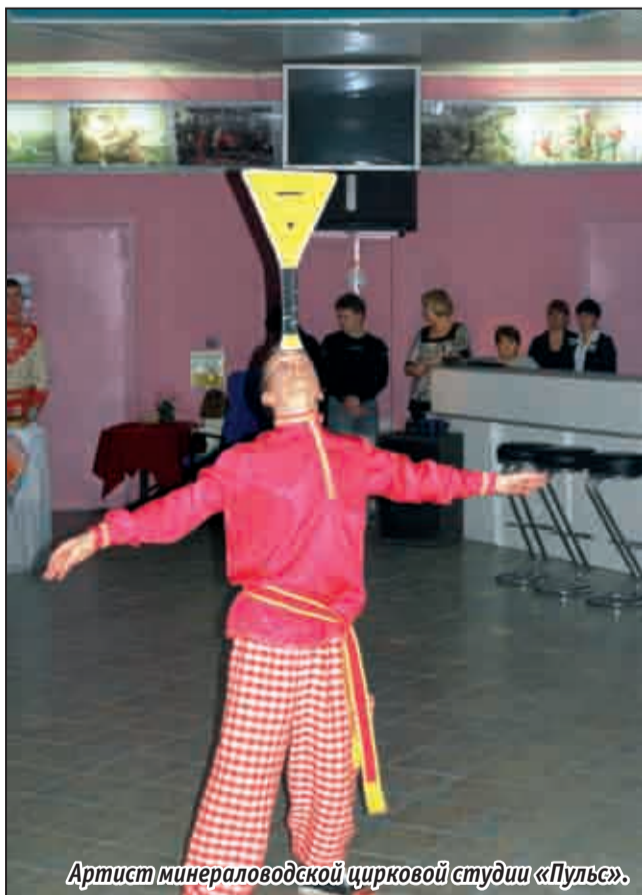
Артист минераловодской цирковой студии «Пульс».

Накануне Масленицы наш корреспондент побывала на веселом празднике, организованном туристской компанией «Валькирия».