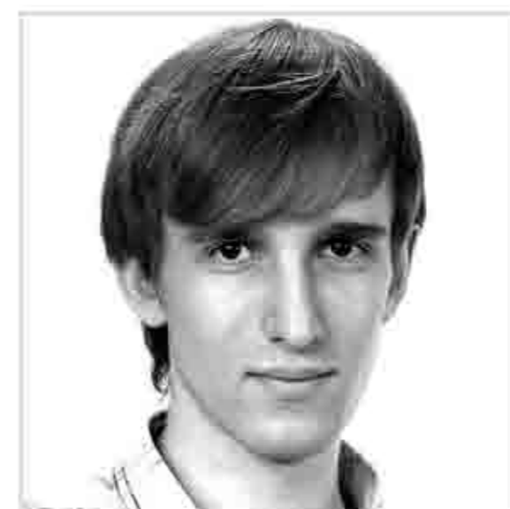
СТАНИСЛАВ ГАЕВСКИЙ ПЕРЕВОДЧЕСКИЙ ФАКУЛЬТЕТ