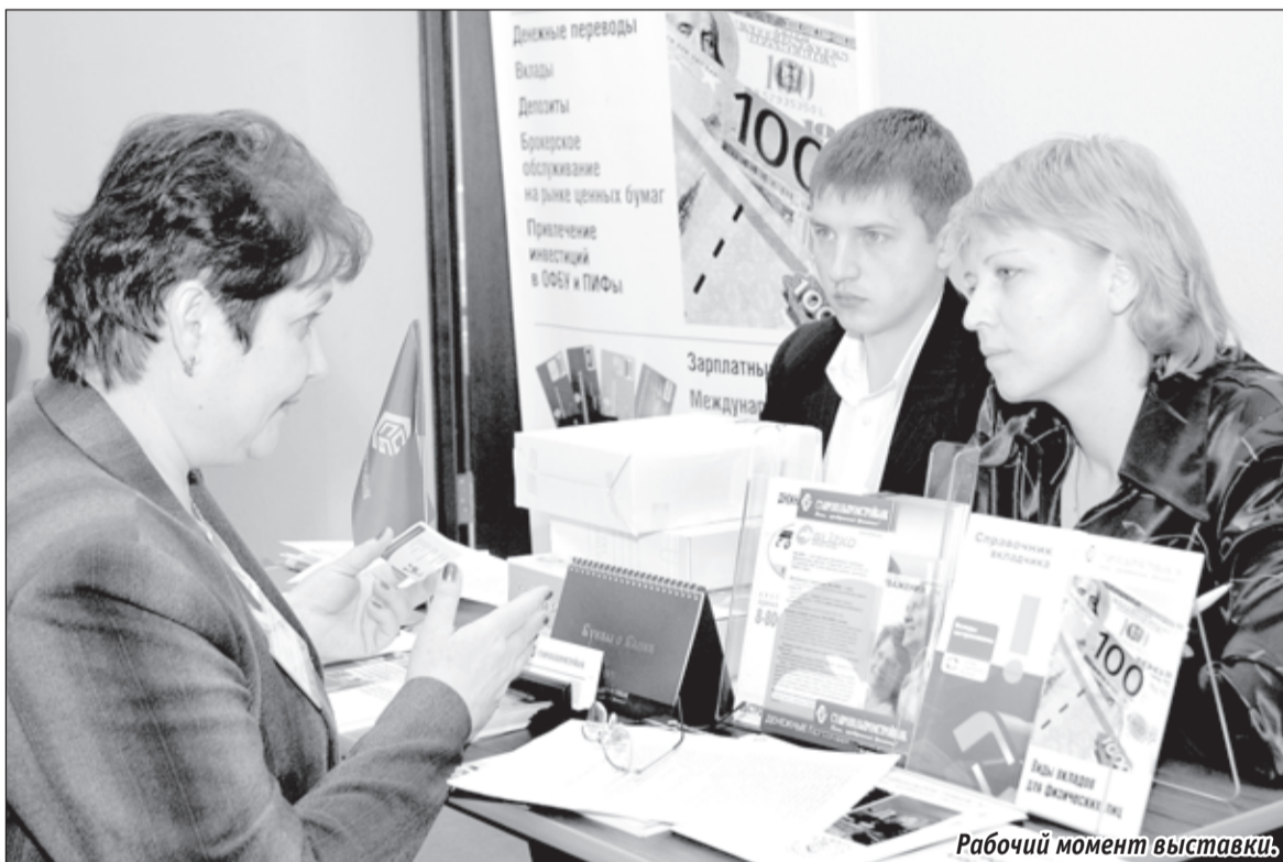
Рабочий момент выставки.

скими. Первый — экономить (не тратить на ненужное и 20 процентов от заработка откладывать). Второй — распределять деньги (непредвиденные расходы, инвестирование, благотворительность, обязательные платежи, одежда, еда и т.д. и т.п.). Третий — создание и управление резервом (он должен составлять сумму заработка минимум за три месяца — грубо говоря, на «черный день»). Четвертый связан с инвестициями. Пятый — планирование семейного бюджета, чтобы обрести защищен-