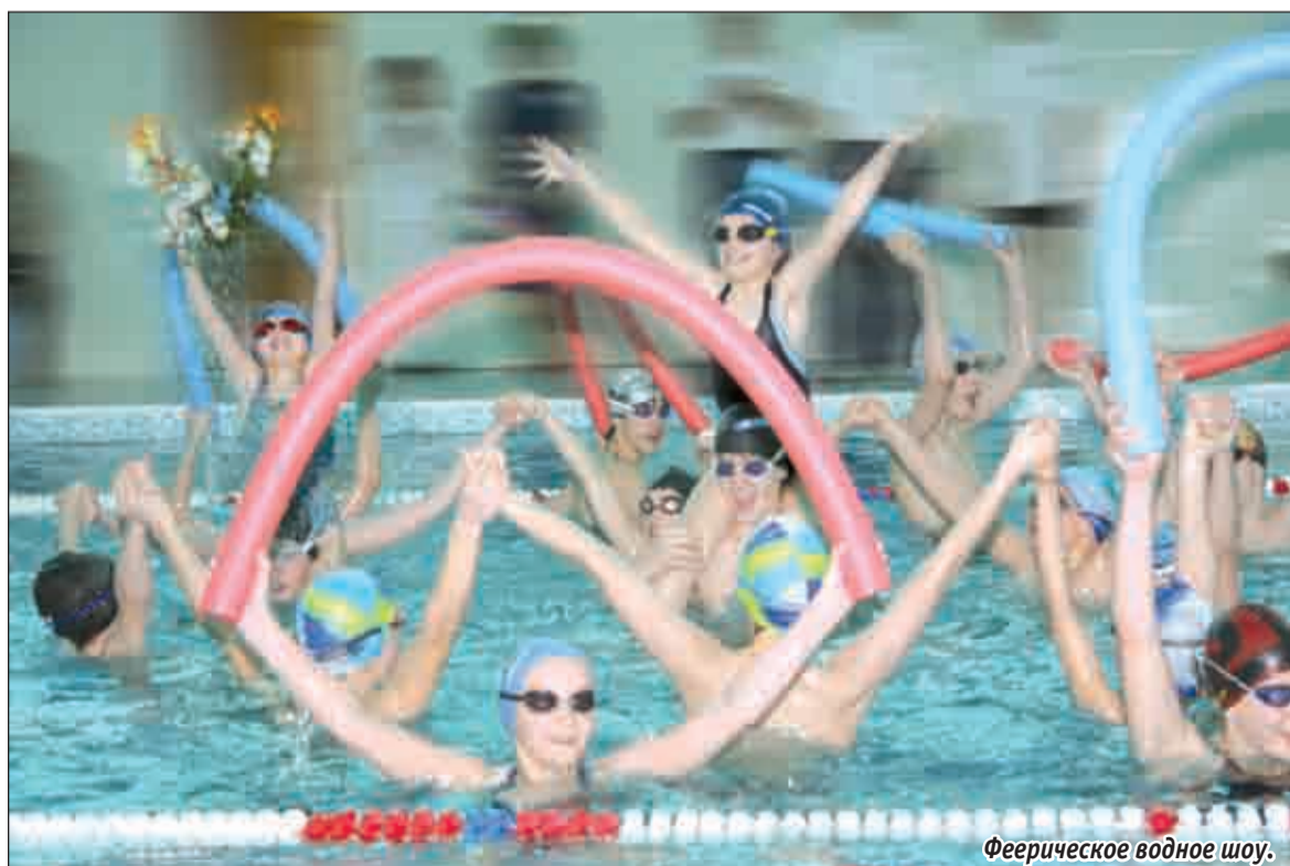
Феерическое водное шоу.