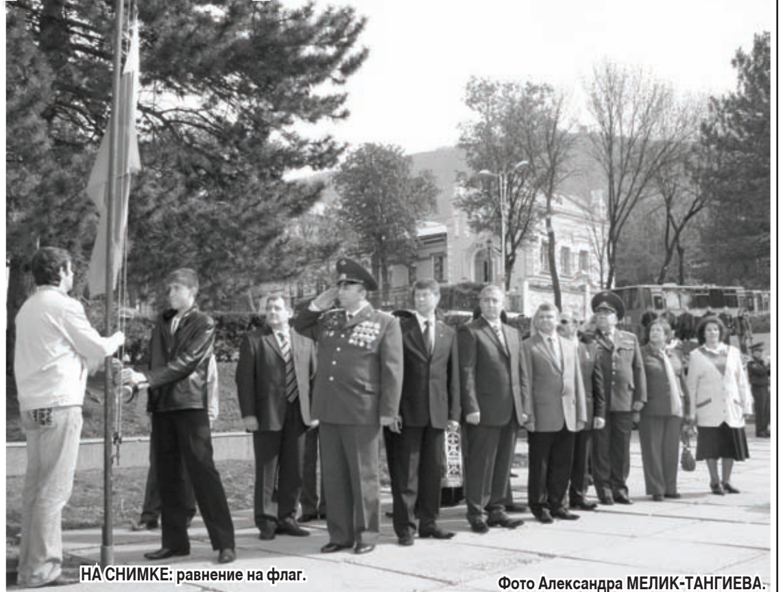
НА СНИМКЕ: равнение на флаг.