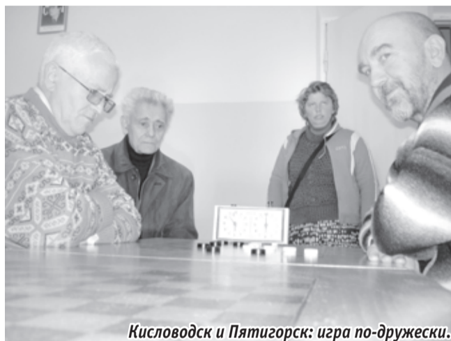
Кисловодск и Пятигорск: игра по-дружески.

Азарта и непредсказуемости встречам добавила новая система построения шашечных поединков: каждый игрок тянет жребий, который определяет ему один обязательный ход. Таким образом, тщательно выверенные