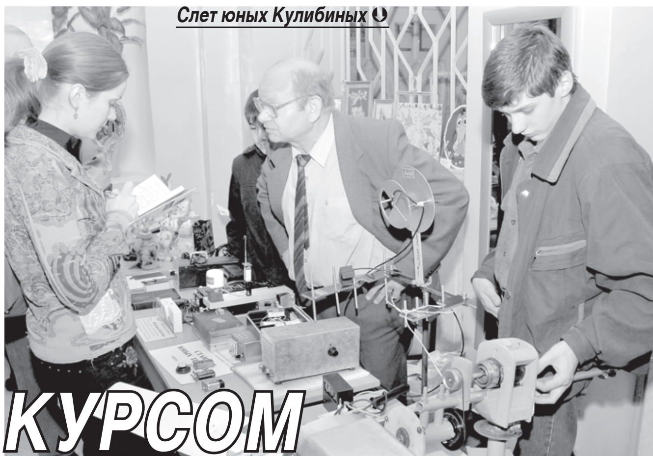
Слет юных Кулибиных