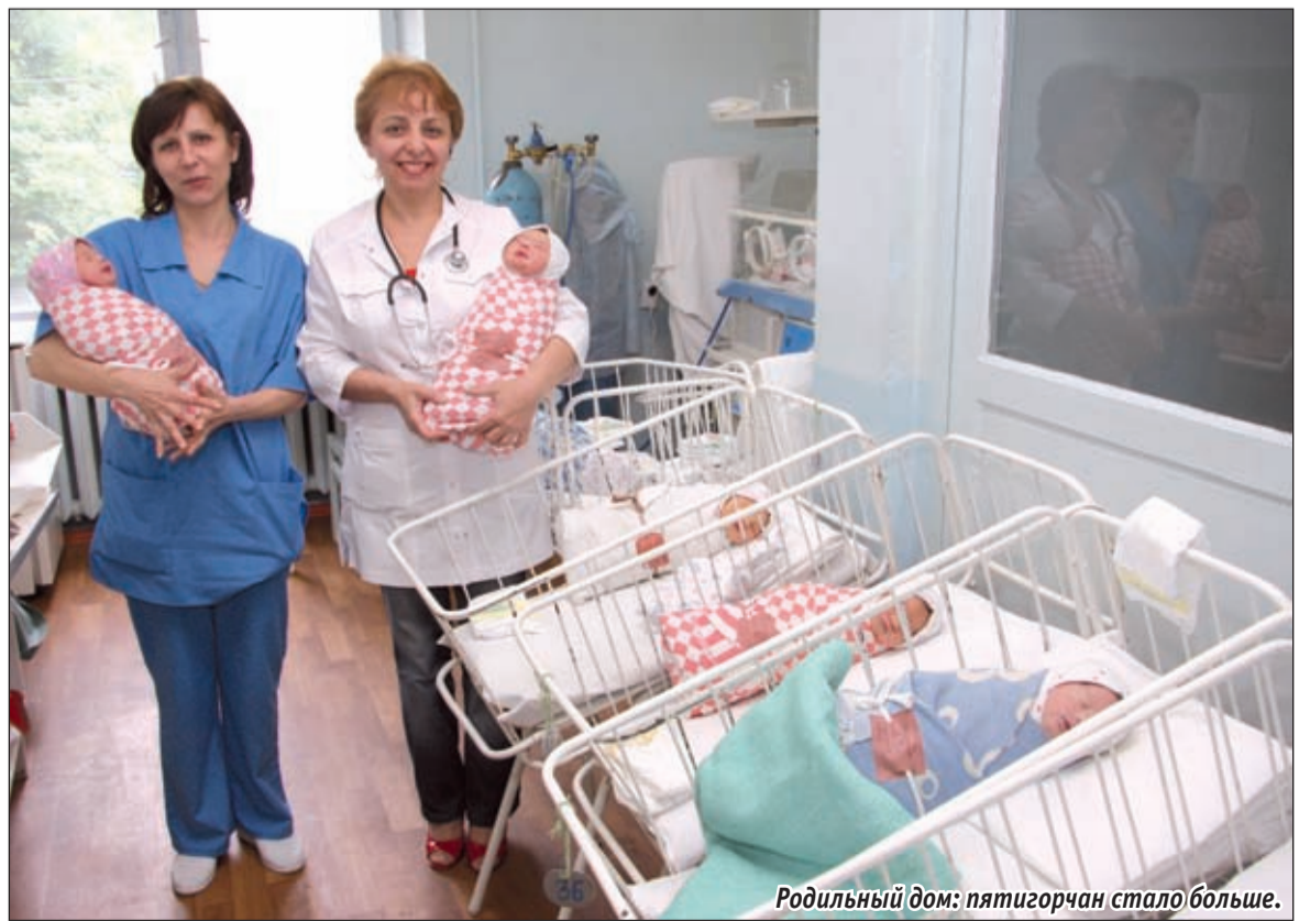
Родильный дом: пятигорчан стало больше.

Татьяна МАЛЫШЕВА.