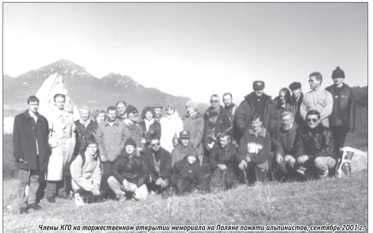
Члены КГО на торжественном открытии мемориала на Поляне памяти альпинистов, сентябрь 2001 г.