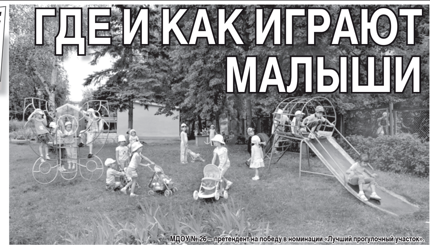
МДОУ №26 — претендент на победу в номинации «Лучший прогулочный участок».

Специалисты оценивают организацию прогулок и питания, расположение зон отдыха, застройки, ягодников и огородов на территории и т.д. Жюри смотр-конкурса имеет на руках серьезный документ, где четко оговорено, за что можно получить