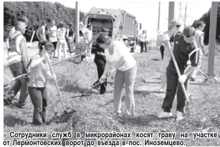
Сотрудники служб в микрорайонах косят траву на участке от Лермонтовских ворот до въезда в пос. Изюмцево.