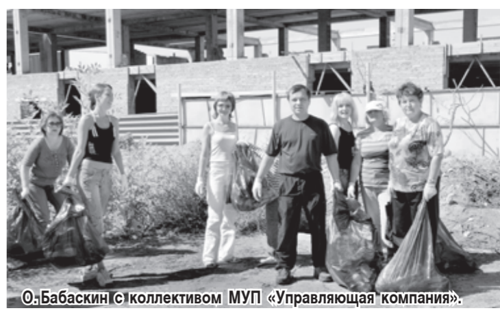
ОлБабаскин) коллективом МУП «Управляющая компания».