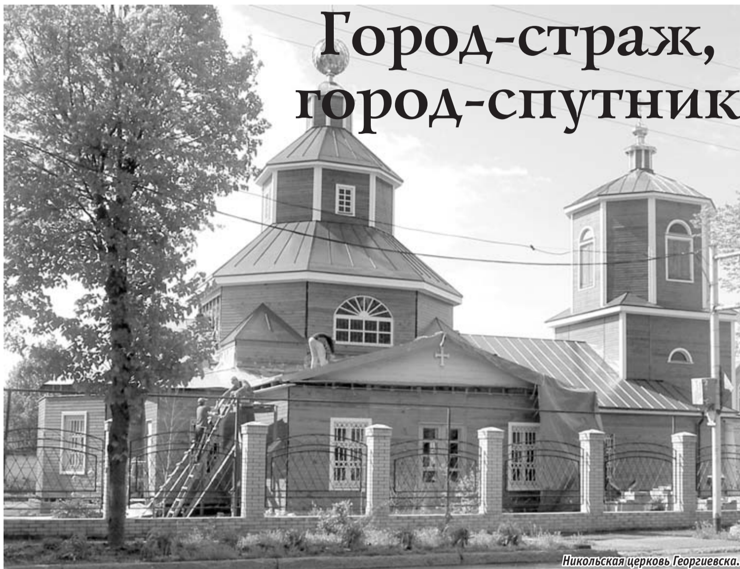
Никольская церковь Георгиевска.

— В 2006 году руководство города приняло «Программу социального и финансово-экономического развития города Георгиевска на 2006-2010 годы». Каковы основные проблемы в данных сферах жизнедеятельности георгиевцев? Каковы основные направления реализации программы? Есть ли очевидные результаты, поскольку программа работает уже два года?