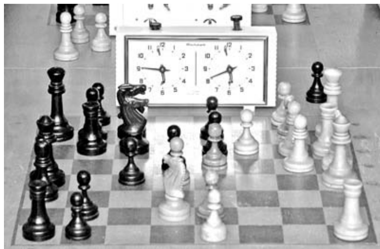
Полосу подготовила Татьяна ЯНАЛИНА.

одной стороны, пропагандировать интеллектуальный спорт среди подрастающего поколения, с другой — предоставлять возможность опытным гроссмейстерам передавать накопленный опыт новому поколению пятигорских шахматистов и шашечников.