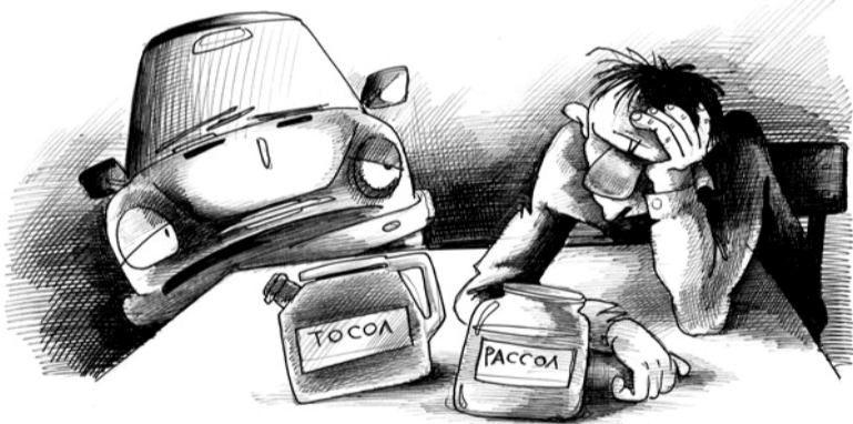
- Ох, блин, что же вчера было ?

место происшествия вызывать не стали и, договорившись о возмещении материального ущерба, с места ДТП дружно уехали (в нарушение пункта 2.5 Правил дорожного движения). В итоге водитель «семерки» по поводу оформления ДТП в органы милиции все-таки обратился, материального возмещения ущерба, который был ему обещан по устному договору, не дождался. Материал ДТП правоохранители ему оформили и в соответствии с законом передали дело в мировой суд, который приговорил его на трое суток ареста за оставление места ДТП. Теперь очередь за гражданином, который управлял злополучным трактором.