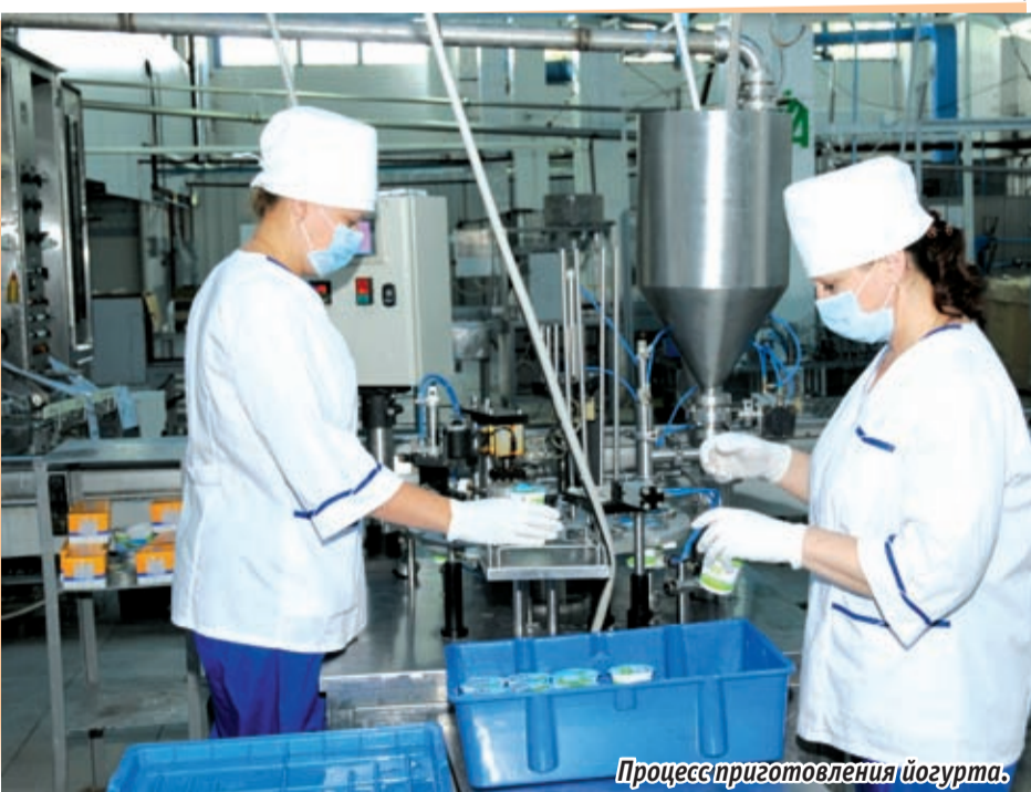
Процесс приготовления йогурта.

— Известно, что Госдума РФ приняла Федеральный закон о введении с 1 января новых технических регламентов на молоко и молочную продукцию. Таким образом полностью исключается возможность обмана потребителей — покупатель должен владеть полной информацией о составе продукта. Допустим, если кефир сделан из сухого молока, он уже будет называться кефирным напитком.