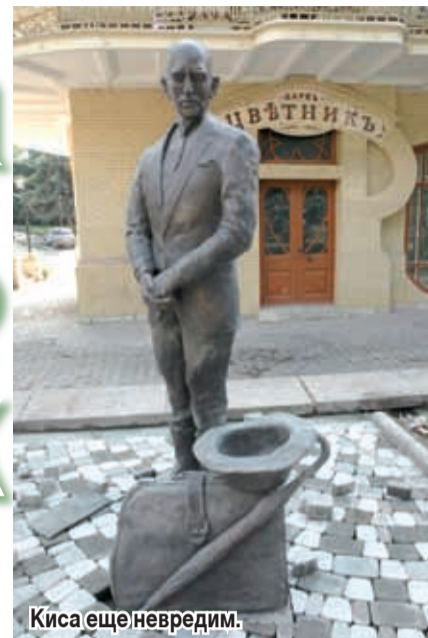
Киса еще невредим.