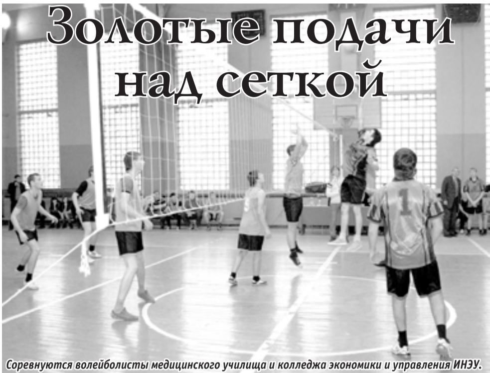
Соревнуются волейболисты медицинского училища и колледжа экономики и управления ИНЭУ.

Первенство Пятигорска по волейболу среди студентов городских средних специальных учебных заведений открылось во вторник, 18 ноября, в спортивном зале Пятигорского торгово-экономического техникума на улице Университетской.