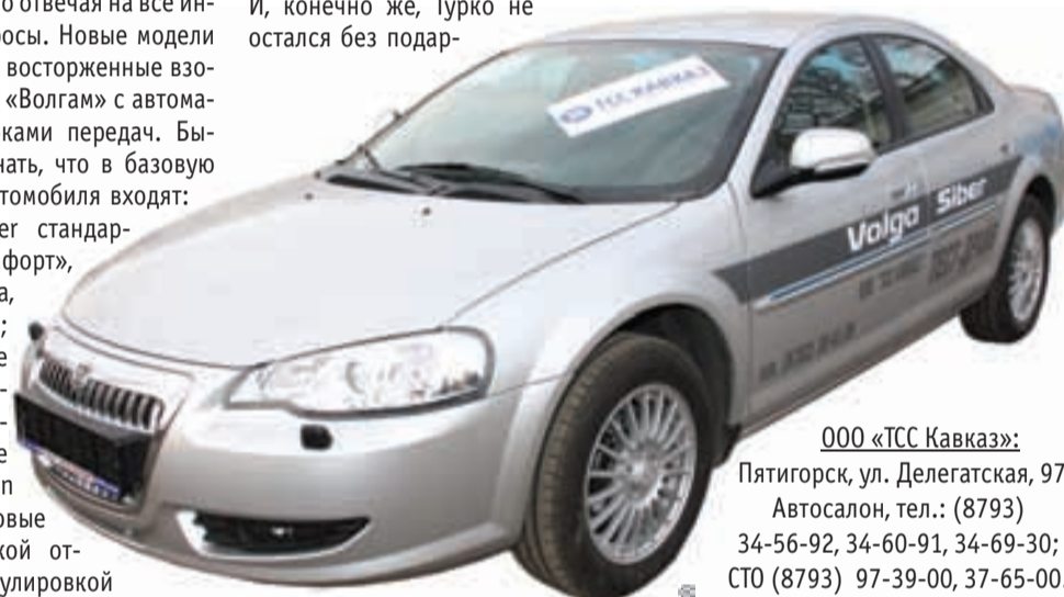
ОАО «ТСС Кавказ»:

Пятигорск, ул. Делегатская, 97. Автосалон, тел.: (8793) 34-56-92, 34-60-91, 34-69-30; СТО (8793) 97-39-00, 37-65-00.