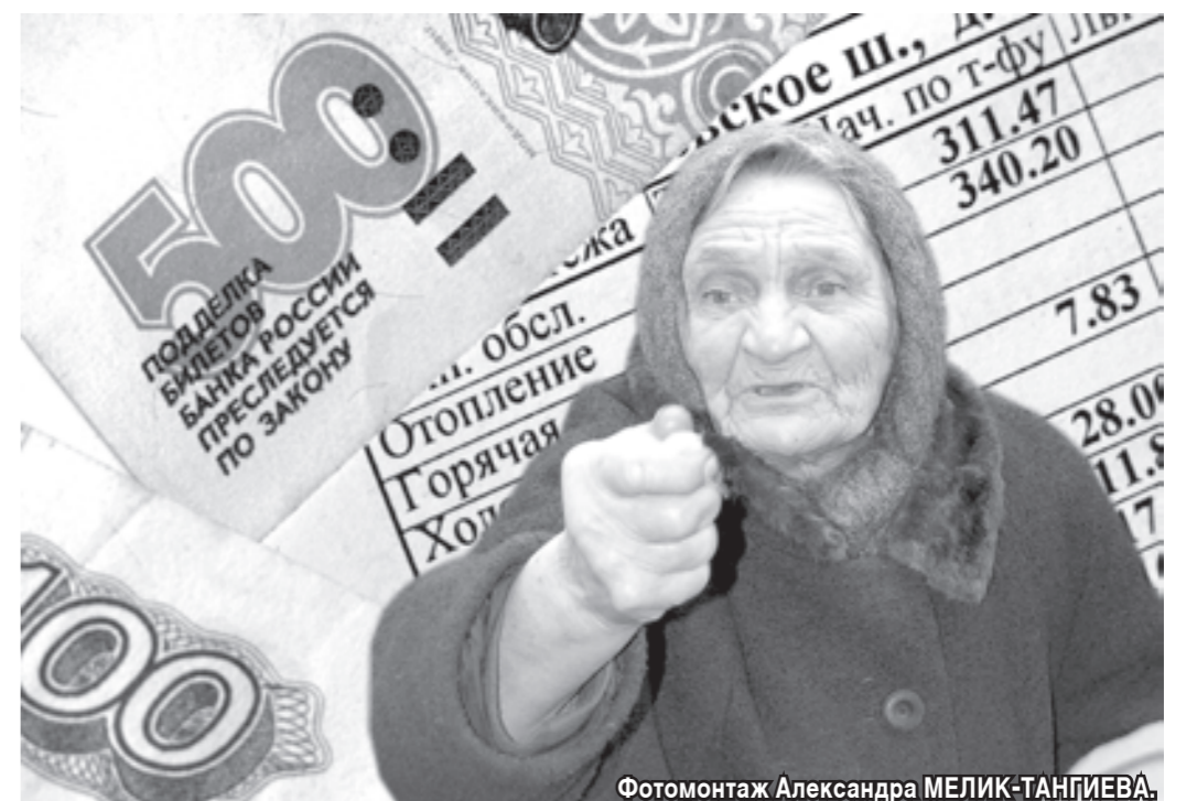
Фотомонтаж Александра МЕЛИК-ТАНГИЕВА.

РЕКЛАМА • ОБЪЯВЛЕНИЯ • РЕКЛАМА • ОБЪЯВЛЕНИЯ • РЕКЛАМА • ОБЪЯВЛЕНИЯ • РЕКЛАМА • ОБЪЯВЛЕНИЯ •