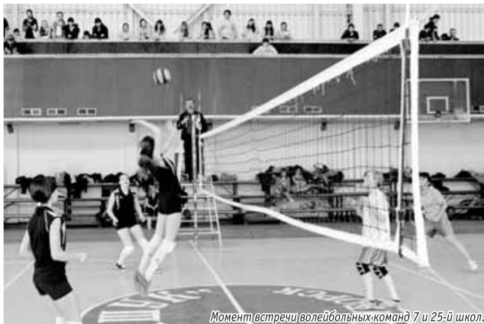
Момент встречи волейбольных команд 7 и 25-й школ.

На прошлой неделе в зале спортивного комплекса «Импульс» завершилось первенство Пятигорска по волейболу среди школьниц 1993 года рождения и младше, в котором принимали участие коллективы 13 средних общеобразовательных школ города.