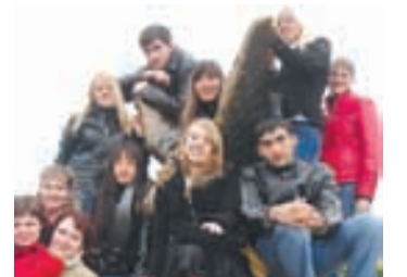
Полосу подготовила Евгения ФЕДОРОВА.

На днях в администрации Пятигорска прошла акция «Я – гражданин России». Главным документом в своей жизни обзавелись 17 горожан, достигших 14-летнего возраста. Вместе с паспортом они получили блокноты с символикой РФ, буклеты Российского Союза молодежи с текстом государственного гимна страны. На сегодняшний день Пятигорск – единственный город в Ставропольском крае, в котором акция «Мы – граждане России!» проводится ежемесячно.