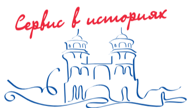
Сервис в историях

Музей Госфилармонии 15 марта в 12.00 — «Детство Д. Кабалевского» из цикла «Всей семьей в концертный зал».