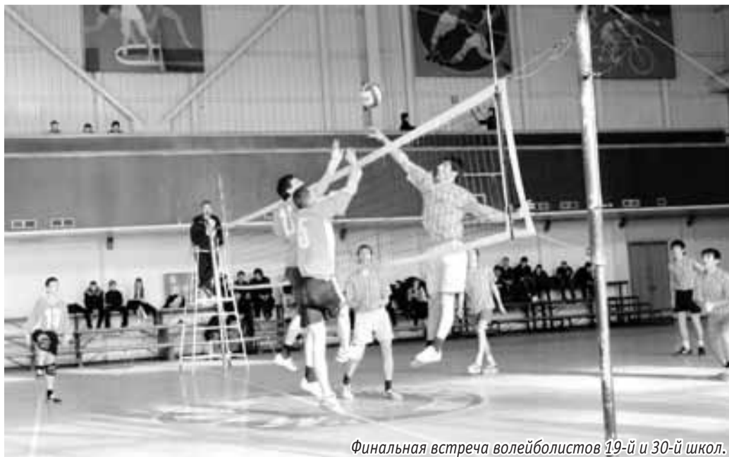
Финальная встреча волейболистов 19-й и 30-й школ.