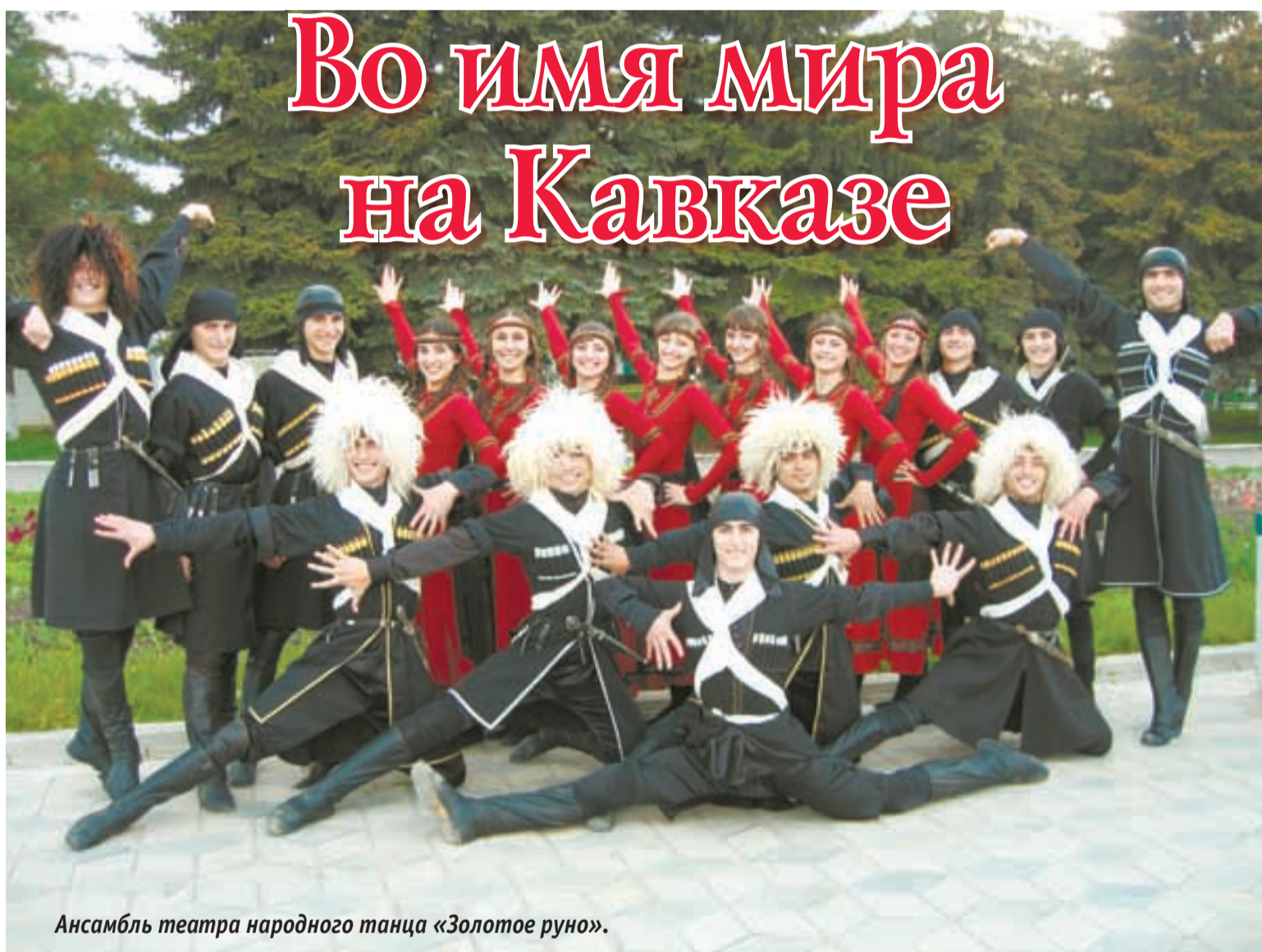
Ансамбль театра народного танца «Золотое руно».

Двойной праздник — День возрождения балкарского народа и День освобождения Греции — состоялся в минувшее воскресенье в Ессентуках в Концертном зале имени Ф. И. Шаляпина. Он был отмечен совместным концертом коллективов национального ансамбля «Балкария» и ансамбля театра народного танца «Золотое руно».