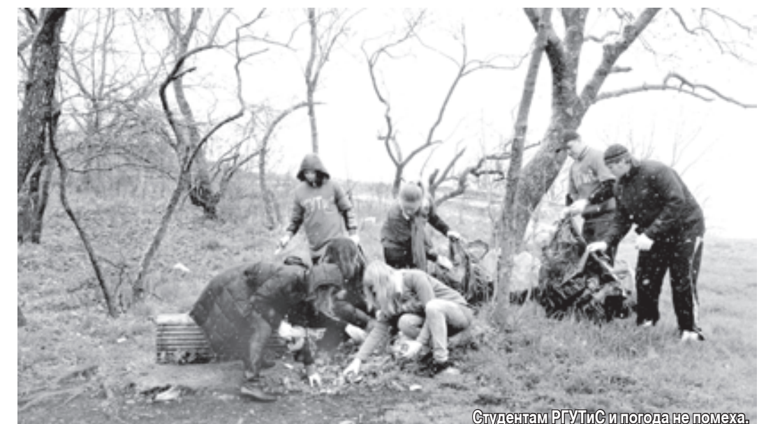
Студентам РГУТиС и погода не помеха.