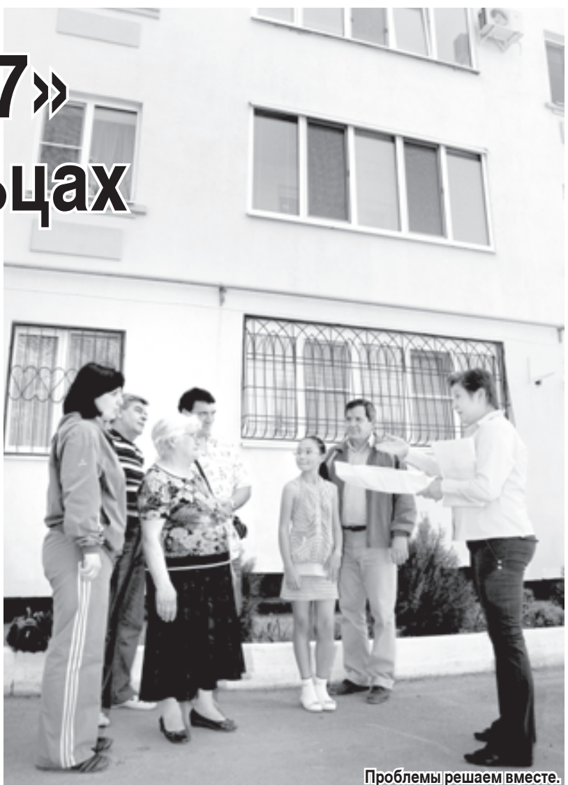
Проблемы решаем вместе.

Хорошее подспорье — общедомовые теплосчетчики, дающие возможность не только оплачивать фактически потребленный ресурс, но и регулировать подачу теплоносителя в зависимости от наружной температуры воздуха. Не сказалося на расчетах для жильцов дома и продление отопительного сезо-