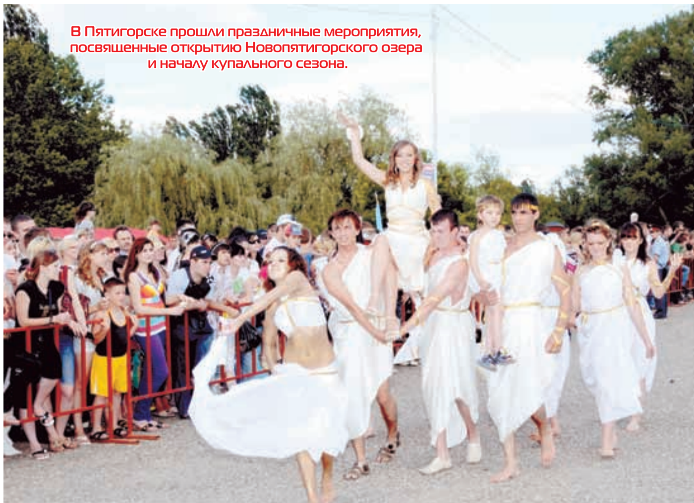
В Пятигорске прошли праздничные мероприятия, посвященные открытию Новоятигорского озера и началу купального сезона.

Что касается всевозможных кафе и палаток — многое пришлось восстанавливать заново, и так из года в год. Откуда только берутся «умельцы», которые ломают питьевые фонтанчики, разбивают фонари и т.д.? Сегодня все указатели снова на своих местах, отремонтированы скамейки, раздевалки, медпункт и другие места общего пользования. Электричество подается бесперебойно. Побелены деревья и бордюры, на специальных площадках установлены мусорные контейнеры. Очень важно и то, что на озере будет дежурить команда профессиональных спасателей, готовых оказать помощь неумелым пловцам в любой момент. В целях обеспечения покоя для отдыхающих на территорию озера запрещен проезд частного транспорта и ежедневно дежурит милицейский патруль. Словом, для полноценного отдыха все готово.