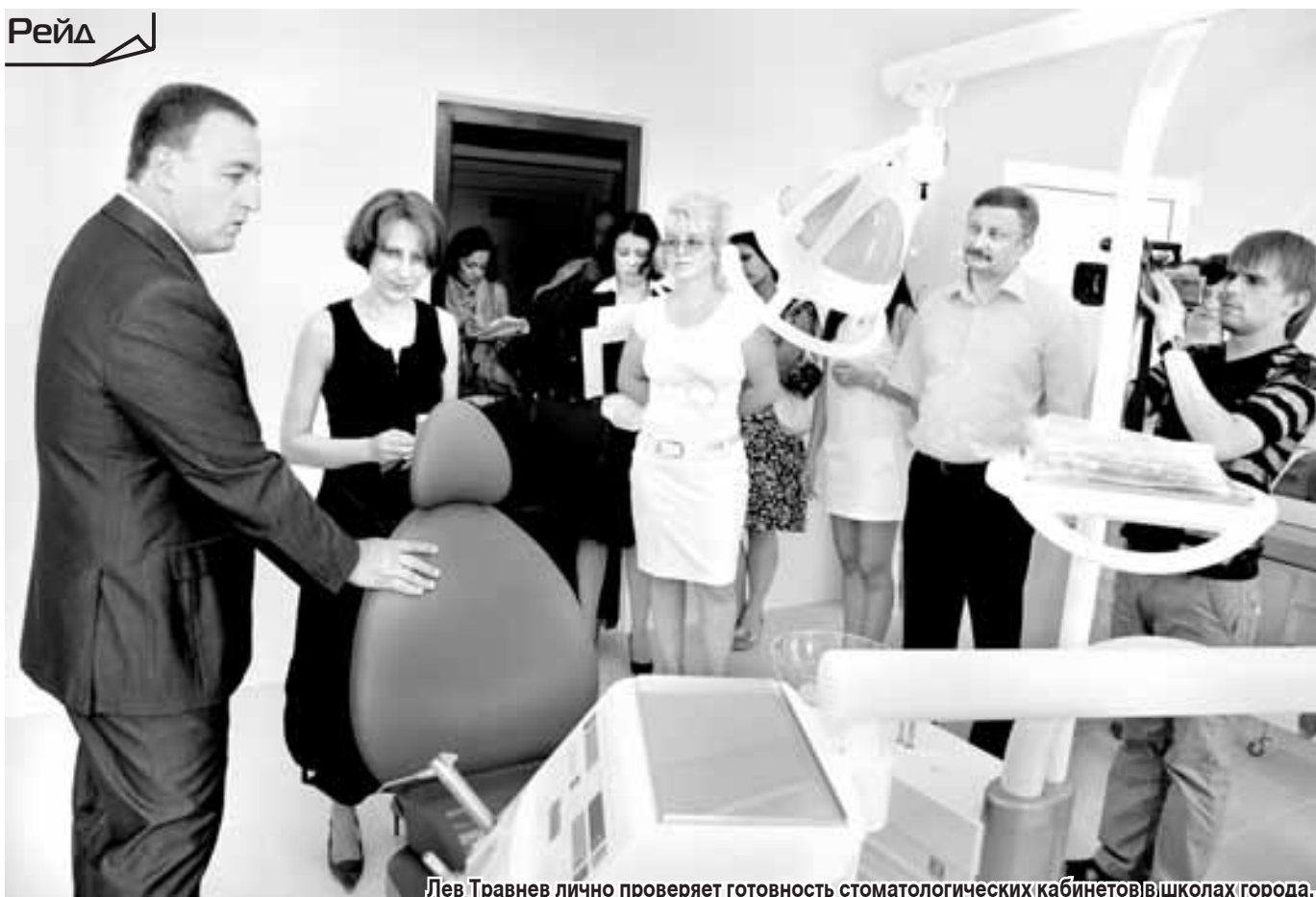
Лев Травнев лично проверяет готовность стоматологических кабинетов в школах города.