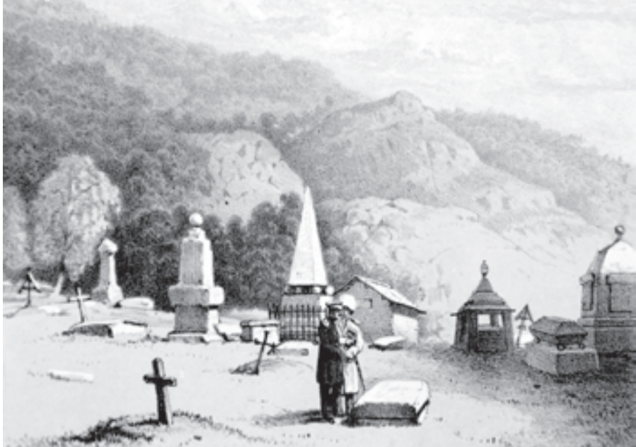
Акварель А. И. Арнольди. Место первого захоронения М. Ю. Лермонтова.