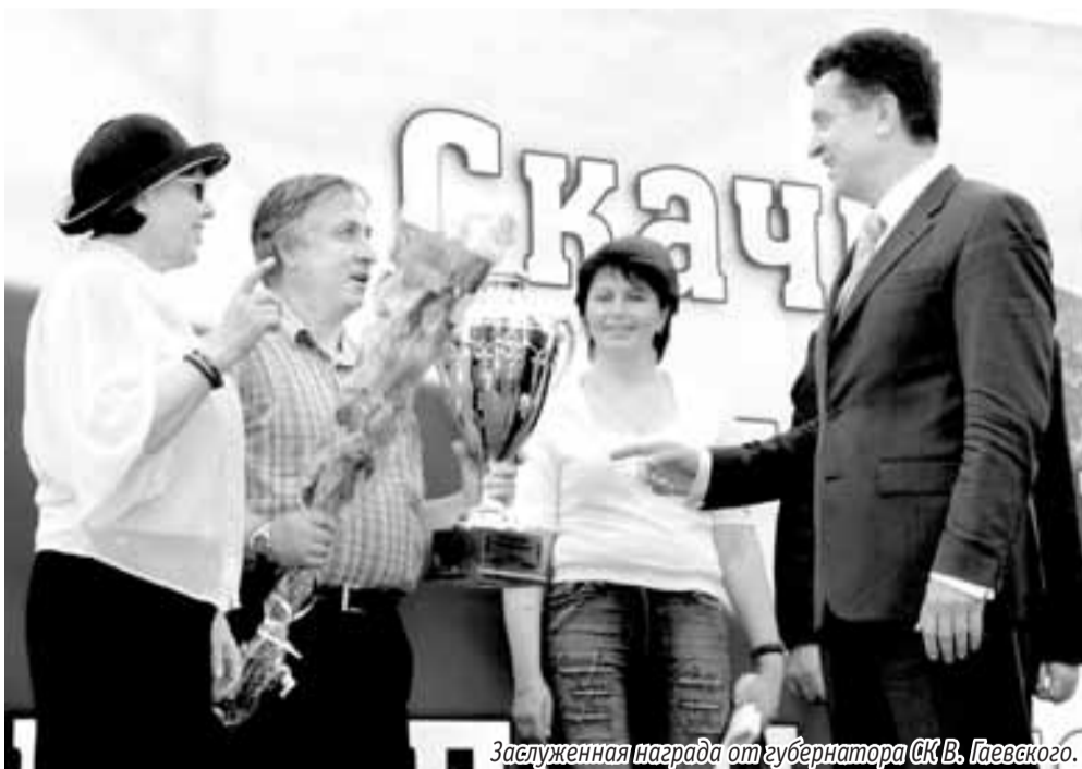
Заслуженная награда от губернатора АК В. Павского.

— Возможно, мой ответ покажется странным, но так уж получилось, что самые серьезные соперники были у моих воспитанников не за рубежом, а на Центральном Московском ипподроме и здесь, в Пятигорске.