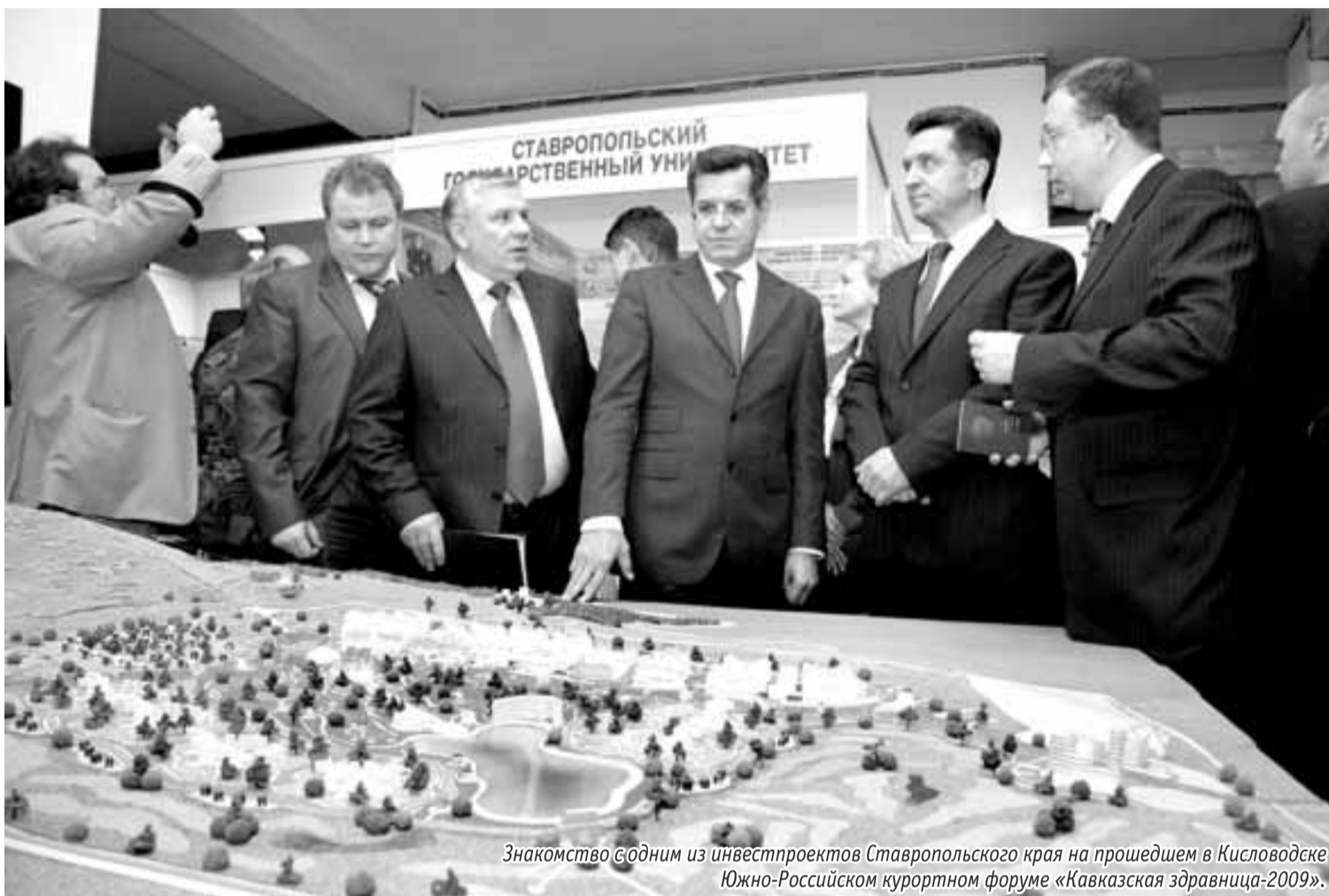
Знакомство с одним из инвестпроектов Ставропольского края на прошедшем в Кисловодске Южно-Российском курортном форуме «Кавказская здравница-2009».

свыше 3,6 млрд. рублей. Также участники форума смогут ознакомиться с проектом ОАО «НК «ЛУКОЙЛ» строительства в Буденновске нефтехимического комплекса. Первый этап реализации инвестпроекта «Строительство комплекса переработки газа месторождений Северного Каспия в этилен и его производные» запланирован на 2009-2012 годы, только на этом этапе НК «ЛУКОЙЛ» плани-