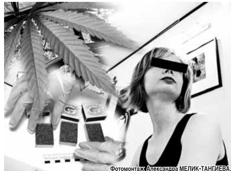
Фотомонтаж Александра МЕЛИК-ТАНГИЕВА.

ледствиях, а главное, как легко ступить на путь преступления, купив «для пробы» сушеной травки. Ведь продавец травки преследует лишь корыстную цель, и ему все равно, кто окажется покупателем — наркоман, страдающий зависимостью, или подросток, не желающий быть белой вороной и поддавшийся давлению сверстников: «Слабо покурить?». Поэтому, оставляя своим детям деньги на карманные расходы, мы не должны забывать о возможности того, что эти деньги детям могут быть потрачены на приобретение наркотических средств: именно в связи с этим с ранних лет необходимо прививать ребятам мысль о здоровом образе жизни, вырабатывая неприязнь к самому слову «наркотики».