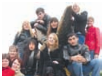
Полосу подготовила Татьяна ПАВЛОВА.

В Невинномысске появился скейт-роллердром. О специальных модульных конструкциях поклонники вело- и скейтспорта два-три года назад могли только мечтать. Но теперь у них есть собственная площадка, где они смогут хоть целые сутки напролет оттачивать свое мастерство. А особенно активные уже приступили к организации соревнований.