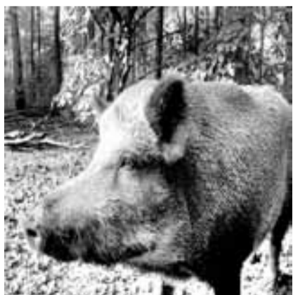
Полосу подготовила Светлана ПАВЛЕНКО.

Но экологи говорят, что с кабанами рано прощаться навсегда. И если природный баланс соблюдать и свиная чума отступит, возможно, что когда-нибудь они вернуться.