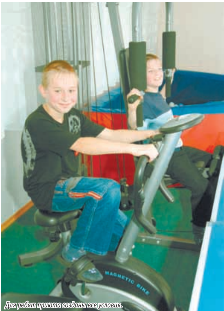
Для ребят приюта созданы все условия.

«Наши специалисты работают и с родителями, часто такое взаимодействие дает положительные результаты