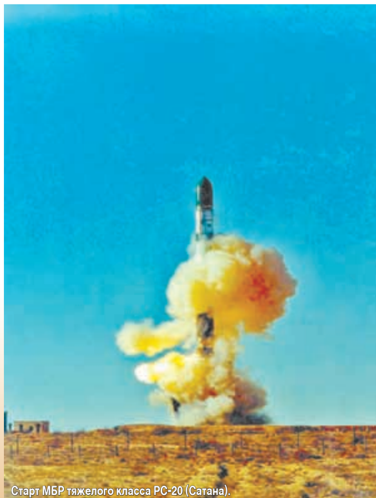
Старт МБР тяжелого класса РС-20 (Сатана).

В испытаниях ракетных комплексов и несении боевого дежурства на командных пунктах непосредственно участвовали свыше 100 ветеранов РВСН, ныне проживающих в Ставропольском крае и регионе Кавказских Минеральных Вод. Общества ветеранов ВС и космодрома «Байконур» поздравляют жителей региона с юбилейной датой — 50-летием со дня создания Ракетных войск стратегического назначения.