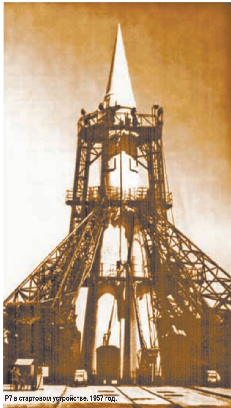
Р7 в стартовом устройстве. 1957 год.