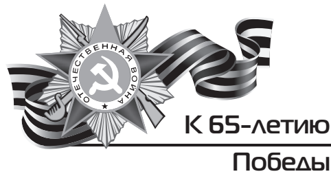
К 65-летию Победы

Сегодня многие ветераны Великой Отечественной войны с подъемом восприняли решение правительства страны улучшить их жилищные условия к 65-летию Победы. В отдел по учету и распределению жилья МУ «Управление имущественных отношений администрации города Пятигорска» уже обратились свыше 200 человек, при этом почти у каждого возникает вопрос: кто может претендовать на государственную помощь.