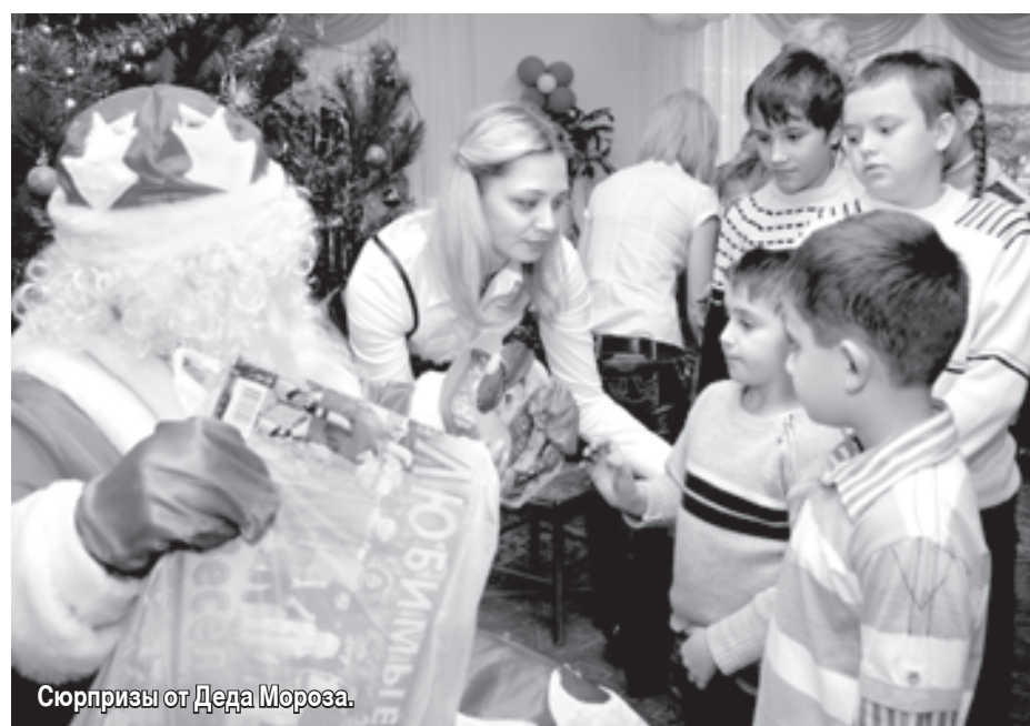
Сюрпризы от Деда Мороза.

великолепно выступили в концерте «Мы встречаем Новый год», который состоялся на базе МУП «Соцподдержка населения». На праздник были приглашены все желающие, что проводил реабилитацию в «Живой нити» (за год здесь побывали более 230 ребят), а также